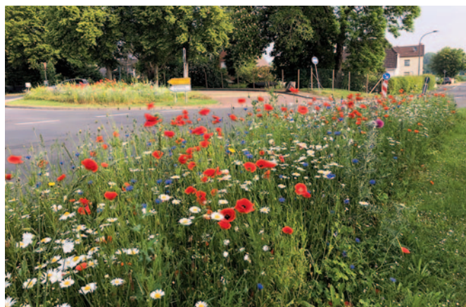
Blühende Farbenpracht: Die insektenfreundlichen Blühstreifen im Stadtgebiet Zülpich ziehen zahlreiche Tiere an – hier am Bachsteinweg.