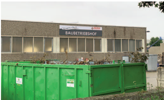
Auch das Gebäude des städtischen Baubetriebshofes in der Blatzheimer Straße wurde mit einer neuen Beschilderung versehen.