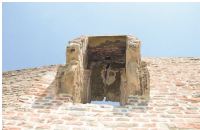
Bei der Sanierung der Überreste des mittelalterlichen Bruderhauses, das einst im Bereich des heutigen Parks am Wallgraben in die Stadtmauer eingebaut war, wurde unter anderem auch dieser Aborterker erneuert.