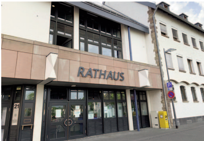
Dank des neuen RATHAUS-Schriftzuges ist nun für jedermann erkennbar, wo sich der Haupteingang zum Zülpicher Rathaus befindet.

Auch das Gebäude des Baubetriebshofes der Stadt Zülpich in der Blatzheimer Straße 8 wurde unlängst mit einer neuen Beschilderung versehen. Von beiden Seiten – also sowohl von der Blatzheimer Straße als auch von der Römerallee aus – ist nun gut zu erkennen, wo die Bediensteten des Baubetriebshofes ihre Basis haben. Von dort starten sie Tag für Tag zu ihren vielfältigen Pflege- und Unterhaltungsmaßnahmen im gesamten Stadtgebiet.