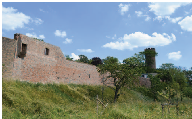
Der zweite Bauabschnitt zur Sanierung der Stadtmauer im Park am Wallgraben beinhaltet unter anderem Überreste eines mittelalterlichen Bruderhauses, das in die Stadtmauer eingebaut war. Dessen alte Giebelwand konnte mit ihren Bestandteilen durch entsprechende Maßnahmen dauerhaft gesichert werden.

Mit dem dritten Bauabschnitt in Richtung Landesburg soll die Gesamtmaßnahme in 2022 abgeschlossen werden. Die Kosten für die gesamte Sanierung belaufen sich auf rund 510.000 Euro. Aus dem Denkmalprogramm des Landes NRW werden alle drei Bauabschnitte mit insgesamt rund 231.000 Euro gefördert. Zusätzlich wird die Maßnahme von der Deutschen Stiftung Denkmalschutz mit rund 70.000 € für die Bauabschnitte 2 und 3 unterstützt.